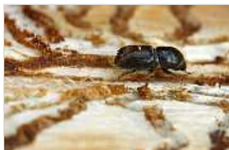
Der Borkenkäfer

Anhören: RealAudio Download: MP3 Podcast: Abonnieren